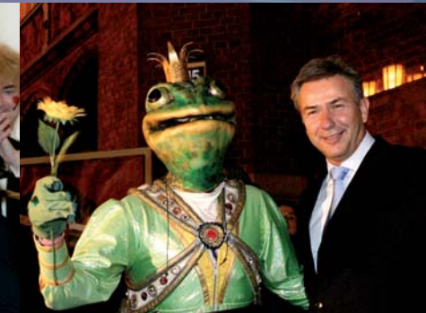
Klaus Wowereit, Regierender Bürgermeister von Berlin