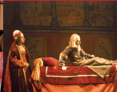
Staatliches Theater Nordgriechenlands