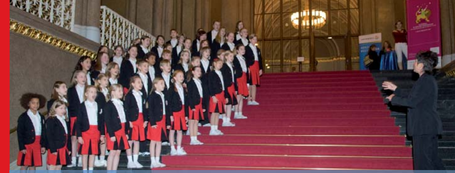
Eröffnung im Roten Rathaus Berlin