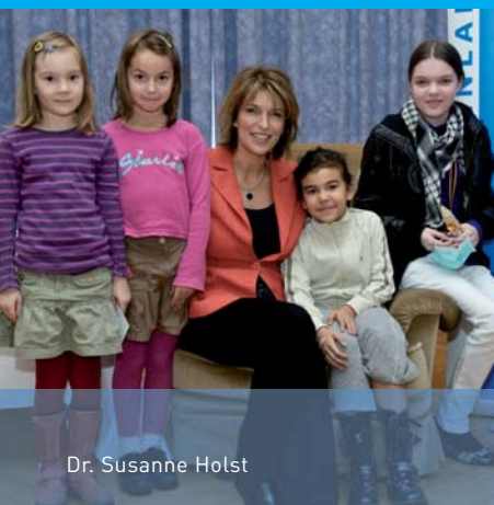
Dr. Susanne Holst

In den DRK-Kliniken erzählen sie die schönsten Märchen vom Heilen.