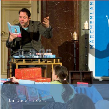
Jan Josef Liefers

Das ganze Jahr über veranstaltet MÄRCHENLAND Märchenstunden. Unterstützt wird die Reihe von prominenten Personen, die aus ihren Lieblingsmärchen lesen.