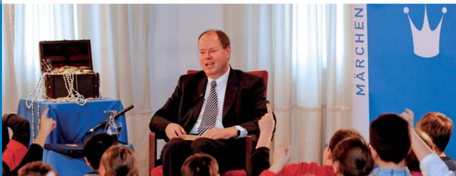
Finanzminister Peer Steinbrück

Seit 2008 haben die Märchenstunden regelmäßig prominente Unterstützung. In der Reihe POLITIKER ERZÄHLEN MÄRCHEN schenken VertreterInnen der Bundes- und Landespolitik SchülerInnen eine Stunde ihrer Zeit und lesen Märchen aus aller Welt.