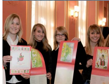
Preisverleihung Internationaler Schülerwettbewerb