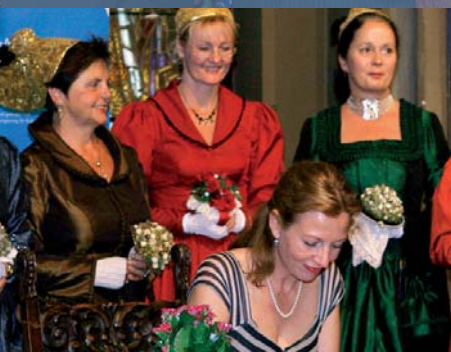
Eröffnung Donauschiff „Arche Europa“ 2007, Eintragung in das Goldene Buch der Stadt Passau