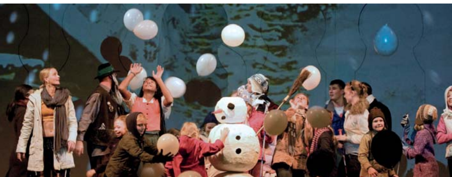
Eröffnung der Vattenfall 19. Berliner Märchentage im Wintergarten Varieté

„Ich freue mich, dass die öffentlichen Bibliotheken in Berlin und Brandenburg seit 20 Jahren Herzstück der Berliner Märchentage sind.“