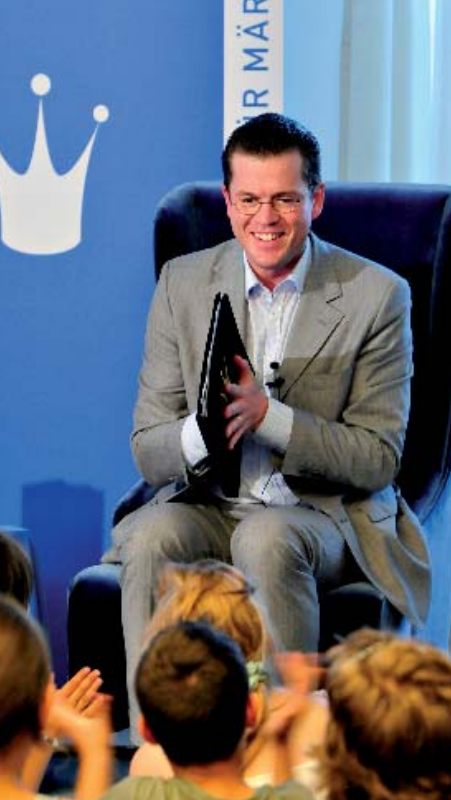
Wirtschaftsminister Karl-Theodor zu Guttenberg

„Wenn das Wünschen noch helfen würde, dann würde man sich jetzt wünschen, noch einmal Kind zu sein. ... Dann liefe man jetzt schnell hinüber zum Brandenburger Tor und flugs hinein ins Max Liebermann Haus. Der Veranstalter, das Deutsche Zentrum für Märchenkultur, lädt zum Event ein.“