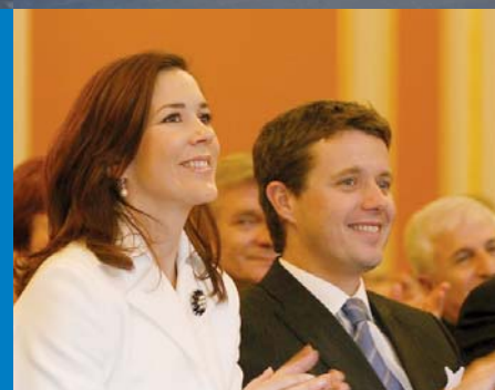
Ehregäste 2004, I.K.H. Prinzessin Mary und S.K.H. Prinz Frederik von Dänemark