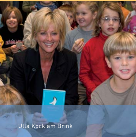
Ulla Kock am Brink