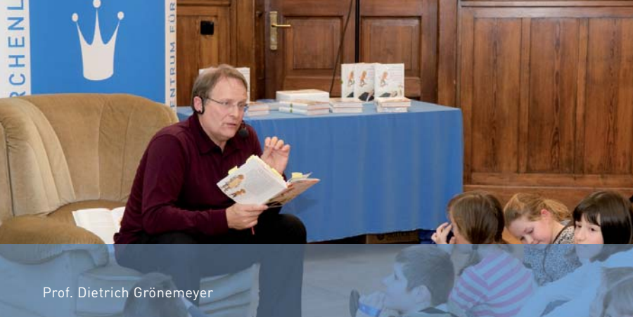
Prof. Dietrich Grönemeyer

„Körper und Seele müssen im Einklang bleiben. Ausreichend Schlaf, regelmäßige Bewegung an frischer Luft und eine ausgewogene Ernährung halten den Körper gesund. Märchen sind Nahrung für die Seele.“