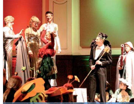
Berliner Sinfonieorchester im Meistersaal