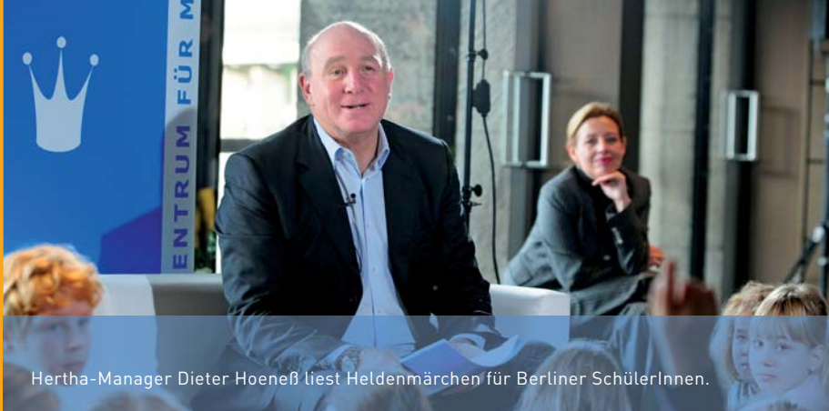
Hertha-Manager Dieter Hoeneß liest Heldenmärchen für Berliner SchülerInnen.