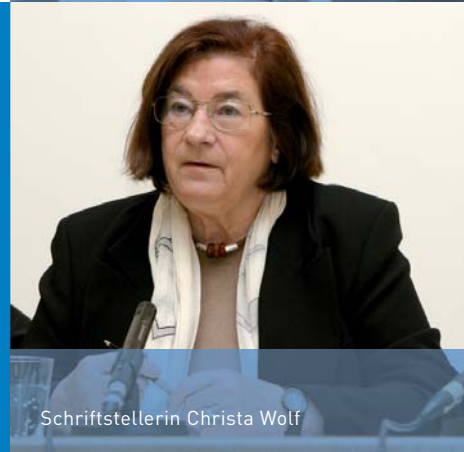
Schriftstellerin Christa Wolf