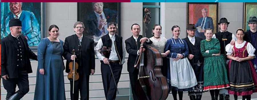
Eröffnung 2006 „Ungarische Märchenzeit“ im Bundeskanzleramt