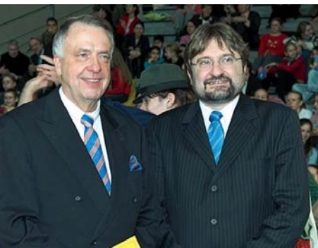
Kulturstaatsminister Bernd Neumann und Kulturminister der Republik Ungarn András Bozóki

Die »ARCHE EUROPA« ist Symbol für ein einiges Europa. Auf seiner Reise verbindet das Schiff unterschiedliche Länder, Menschen und deren Kulturen.