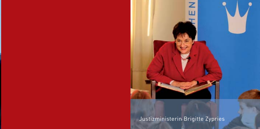
Justizministerin Brigitte Zypries