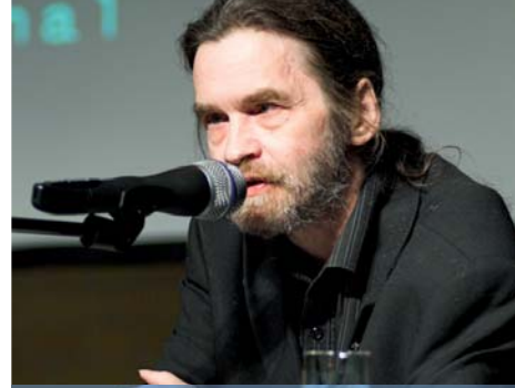
Schriftsteller Wolfgang Hohlbein

Dafür steht MÄRCHENLAND ein Expertenstab zur Seite.