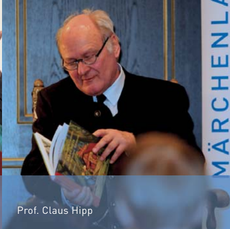
Prof. Claus Hipp